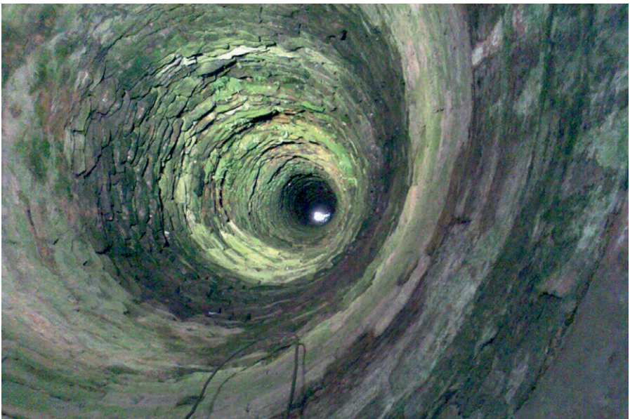
Brunnen der Festung Marienberg, Würzburg, um 1200, Tiefe 102 m

Voraussetzung für einen nachhaltigen Grundwasserschutz sind die Überwachung und Kontrolle des Grundwassers hinsichtlich Qualität und Menge. Dies gilt insbesondere für die Schutzzonen und Zustrombereiche der Wasserversorgung. Der Untersuchungsumfang muss alle trinkwasserrelevanten Stoffe abdecken. Erforderlich ist hierzu ein an regionale Gegebenheiten angepasstes Messnetz, das eine flächendeckende und risikoorientierte Beurteilung zum Schutz der Trinkwasserversorgung erlaubt. Modellrechnungen können die Datenlage aus Messnetzen unterstützen, jedoch keinesfalls ersetzen, wenn es darum geht, belastete Gebiete sicher und zuverlässig zu erkennen. Bei der Ausgestaltung von Messnetzen zur Grundwasserüberwachung ist auf eine ausreichende Vorwarnzeit für die Wassergewinnung zu achten, so dass Abwehrmaßnahmen rechtzeitig ergriffen und nachteilige Trends wirksam umgekehrt werden können. Neben der Überwachung ist auch ein konsequenter Vollzug gemäß Vorsorge- und Verursacherprinzip Kernaufgabe der Verwaltung.